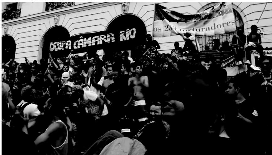
Ocupa Câmara depois do Ato “7 de setembro dos excluídos”. 7/09/2013.

A praça do comum é constantemente privatizada, mas eternamente resgatada, reocupada, reencontrada. O espetáculo não está nos cinemas. Está no no chão, nas ocupações temporárias. Os atores somos todos nós. E os conflitos são todos os nossos.